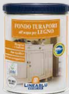
HU 3051 BIANCO