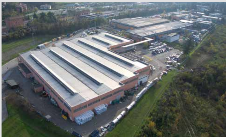
Stabilimento produttivo di Pianoro (BO)

Al suo interno troverete consigli utili sulle tecniche di applicazione di tutti i nostri prodotti, destinati alla manutenzione, al restauro dei mobili, ai ritocchi e alla verniciatura di serramenti, porte, portoni d'ingresso, parquet ecc. Un valido aiuto per entrare nel meraviglioso mondo dei colori e riavvicinarsi ad antichi mestieri!